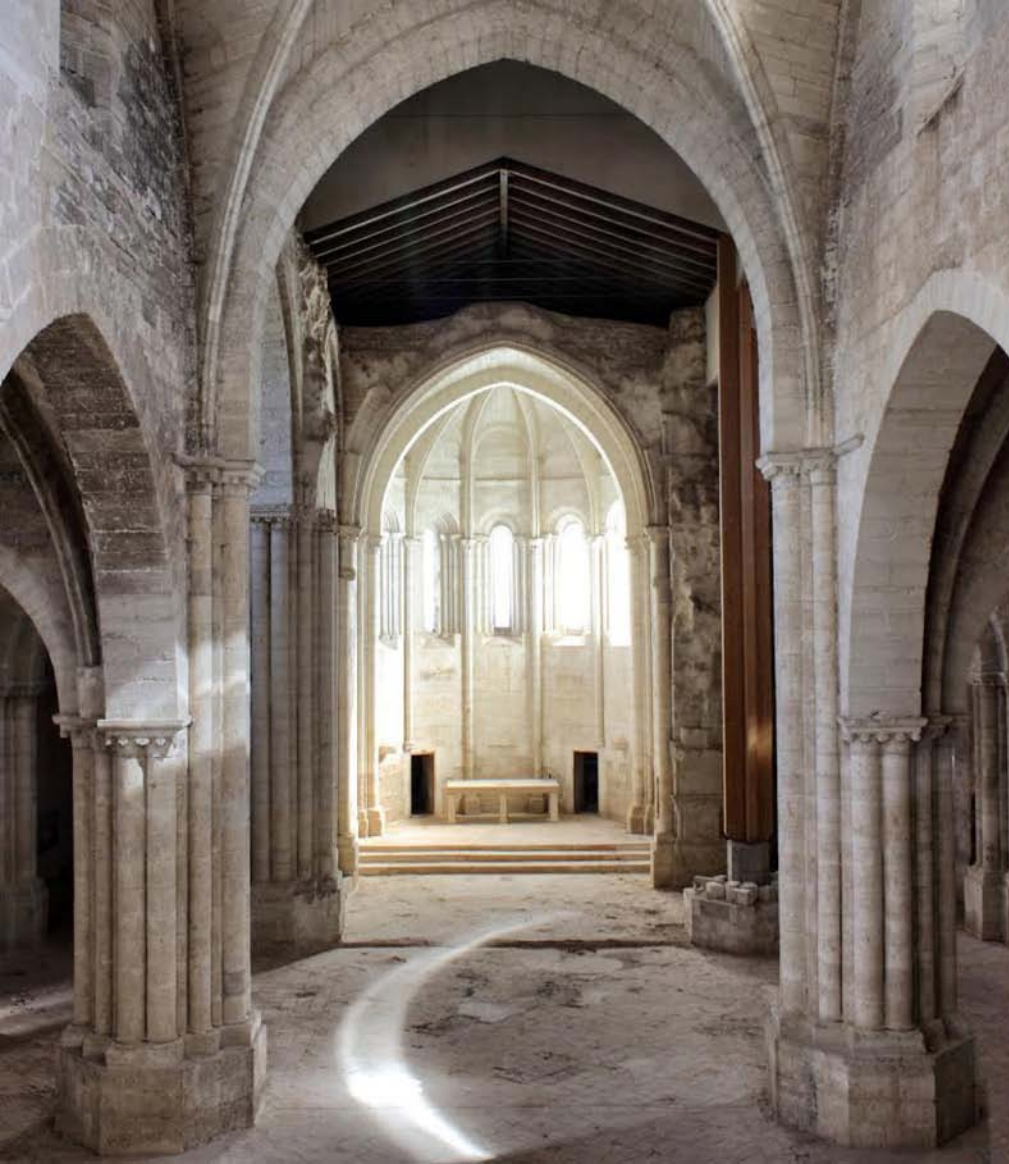
Vista interior del Monasterio de de Santa María de Palazuelos